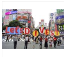
きょう世界環境デー 化石燃料、ゼロへ 関連企業への投資ストップ 経済、金融業界にも波及