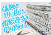
情報収集のプロが調査 「切り抜き」から見る、2018年SNS最新トレンドとは？