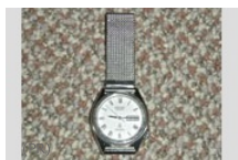
シンプルがいい 東野圭吾さん 「ぼくは、基本的に物への欲、物欲がないんですよ」