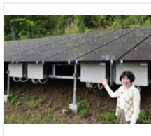
現場から コープこうべ、電力事業好調 契約数、昨年から倍に 環境志向の高まり追い風 / 兵庫