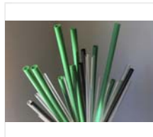
欧州ニュースアラカルト 「EUがストロー禁止」の裏を読む