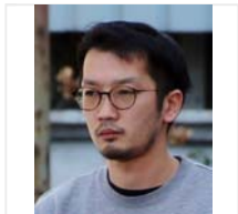
目黒虐待死 5歳長女、軟禁状態か 転居後の外出1回